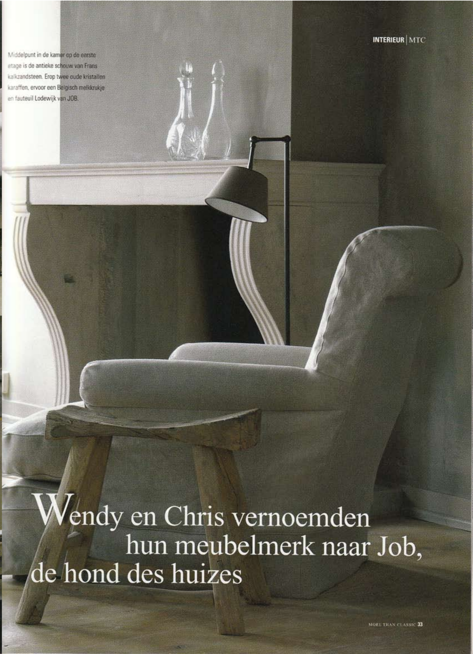
Middelpunt in de kamer op de eerste etage is de antieke schouw van Frans kalkzandsteen. Erop twee oude kristallen karaffen, ervoor een Belgisch melkkrukje en fauteuil Lodewijk van JOB.